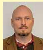
Per Lekberg Arkeologienheten