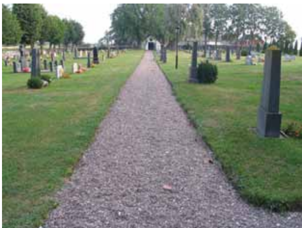
Grusgången från kyrkan mot bårhuset i norr. Till vänster kvarter C och till höger kvarter H och F. (KI Hulterstad kyrkog 011)

I norra delen av kyrkogården ligger en byggnad som tidigare använts som benhus och därefter som ved- och redskapsbod. År 1957 inreddes byggnaden till bårhus. Ritningarna till ombyggnaden gjordes av byggmästare Henning Johansson. Fasaden är putsad och avfärgad i vitt utom en del av gaveln i norr som har en stående träpanel i svart. Taket är belagt med tegel. Samtliga fönster och dörrar har svarta snickerier. Norra delen av byggnaden används som förråd medan den södra är ett inrett andaktsrum. Innertaket i andaktsrummet är klätt med plattor, väggarna är putsade och avfärgade i vitt och golvet belagt med plattor av kalksten. Den norra väggen har en målning av konstnären Rune Söderberg. Här finns en katafalk samt ett litet altare av sten.