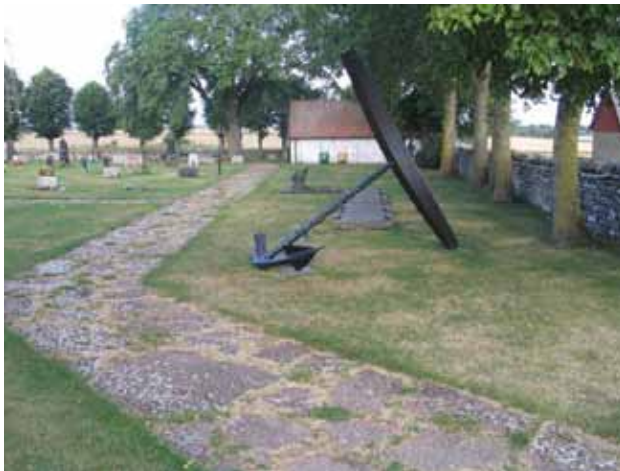
Monumentet över de omkomna ombord på Kronan 1676. (KI Hulterstad kyrkog 013)

ankare, fyra kvadratiska stenblock med järnringar i varje hörn samt en liten minnesplatta i sten med texten ”Tappra svenska män ombord Stora Kronan i slaget vid Öland 1676”.