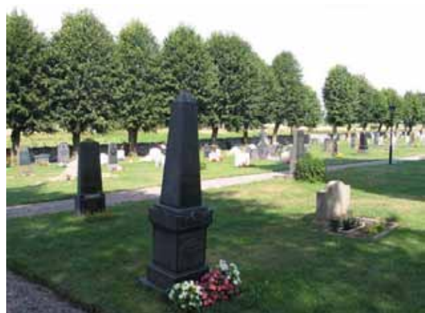
Fyra av de fem gravvårdarna i kvarter H.