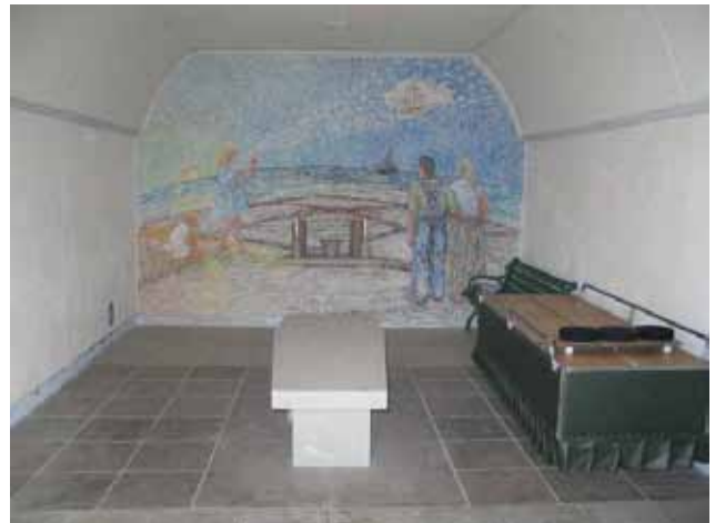
Bårhusets norra vägg har en altarmålning av konstnären Rune Söderberg. (KI Hulterstad kyrkog 014)