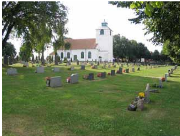
Kvarter D från nordsväst. (KI Hulterstad kyrkog 038)