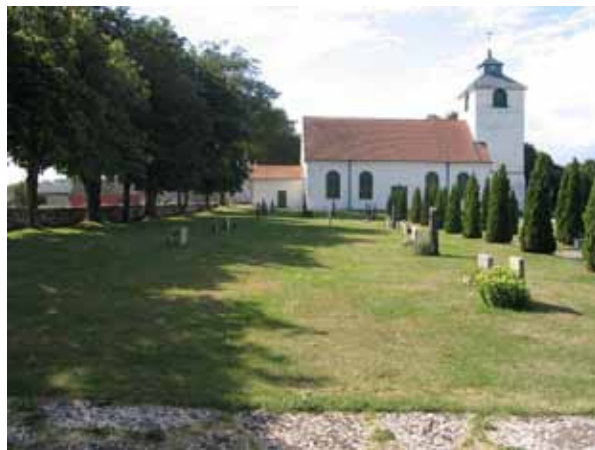
Kvarter G från norr. (KI Hulterstad kyrkog 051)