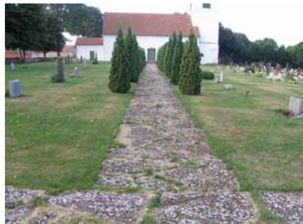
Gång belagd med kalkstensflis fram till kyrkans norra ingång. Till vänster kvarter G och till höger kvarter F. (KI Hulterstad kyrkog 012)