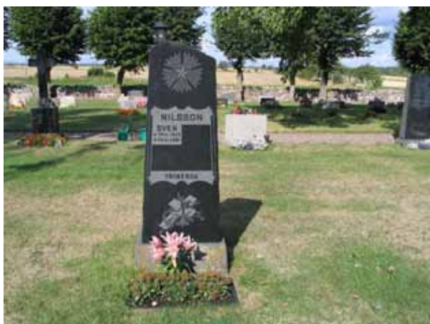
En hög svart gravvård som ursprungligen måste ha tillverkats omkring sekelskiftet har här återanvänts genom att vården fått en ny inskription. Kvarter F. (KI Hulterstad kyrkog 045)

olika tider. I kvarter F är flest antal vårdar från slutet av 1800-talet och början av 1900-talet med man i kvarter G inte kan urskilja någon period som mer representerad än andra. De flesta gravvårdarna är av svart eller grå granit men det finns också vårdar av röd granit och kalksten. I kvarter F finns två höga gravvårdar av svart granit som kröns av marmor kors. Denna typ av vård är inte så vanlig. I kvarter G finns ett modernt träkors. Att ange yrkestitlar förekommer i båda kvarteren. De vanligaste titlarna är lantbrukare, hemmansägare och ålderman, men det finns också titlar som fiskare och bysmed. På majoriteten av vårdarna finns angivet från vilken by eller gård den döde kommer.