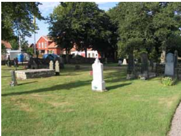
Kvarter A från nordost. (KI Hulterstad kyrkog 018)

Kvarteren A, och H är de äldsta områdena på kyrkogården. Söder om kyrkan ligger kvarter A som beräknas rymma 205 gravplatser. Här finns flera av kyrkogårdens äldsta gravvårdar. Kvarter H sträcker sig från ett område väster om kyrkans torn och fram till vinkeln mellan koret och långhuset. Kvarteret omfattar endast 10 gravplatser. Gravvårdarna i kvarteren är placerade i rader där majoriteten av vårdarna är vända mot öster och i annat fall mot väster. Raderna är dock inte alltid raka vilket tillsammans med de äldre gravvårdarna bidrar till att ge kvarteren en ålderdomlig karaktär.