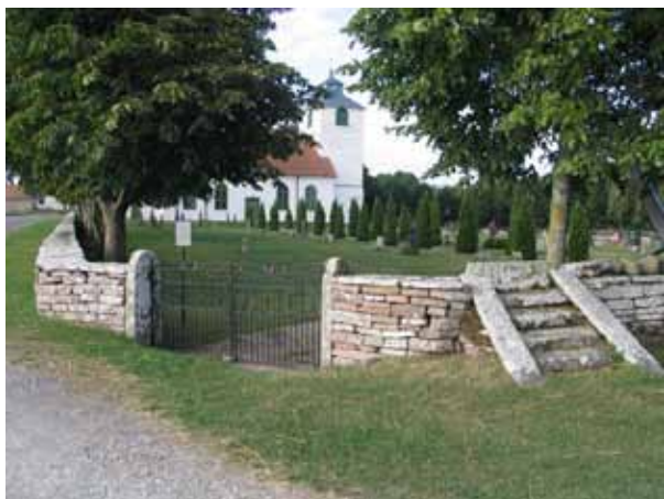
Kyrkogårdens ingång i nordost med dubbla smidesgrindar och klivstätta. (KI Hulterstad kyrkog 005)

Gångar leder fram till kyrkans ingångar och till bårhuset i norr. De sammanbinder kyrkogårdens olika delar och i en del fall fungerar de också som gräns för gravkvarter. Gångarna söder om kyrkan och norr ut fram till bårhuset är belagda med grus medan gångarna från kyrkans ingång i norr samt från ingången i nordost fram till bårhuset är belagda med kalkstenplattor. Tidigare fanns flera gångar som idag är insådda med gräs. Man kan dock fortfarande se var de gick.