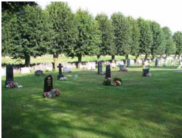
Kvarter B från sydväst. (KI Hulterstad kyrkog 027)

Kvarteren B, C och D tillkom vid den utvidgning av kyrkogården som gjorde 1919. De ligger i rad utmed kyrkogårdens västra gräns med kvarter B längst i söder och kvarter D i norr. Enligt gravkartan ska här finns 68, 118 respektive 87 gravplatser. Dessa tre kvarter har från början haft en bestämd anläggningsform. Här är gravvårdarna placerade i raka rader och kvarteren andas ordning och enhetlighet.