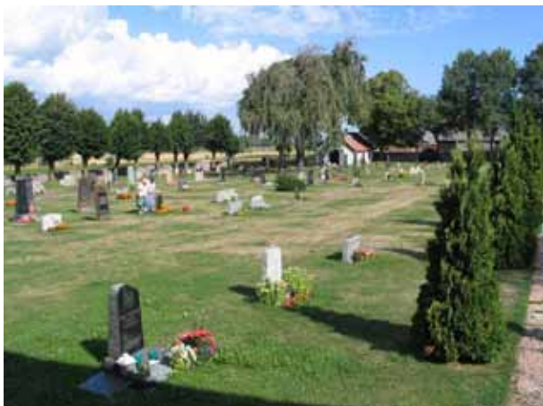
Kvarter F från sydost. (KI Hulterstad kyrkog 050)

Norr om kyrkan ligger kvarteren F och G. De ligger i kyrkogårdens längdriktning och skiljs åt av en gång kantad av höga tujor. I väster avgränsas kvarter F av ytterligare en av kyrkogårdens gångar. Kvarter G avgränsas i öster av kyrkogårdens mur. I söder utgör kyrkan gräns och i norr gången mot kvarter E. De båda kvarteren är kyrkogårdens största med flest planerade gravplatser. Kvarter F beräknas rymma 364 och kvarter G 298 gravplatser. 66 av platserna i kvarter G är planerade för urngravar. I båda kvarteren finns dock stora ytor med lediga gravplatser, framförallt i norra delen av kvarter G. I nordvästra delen av kvarter F växer två hängaskar.