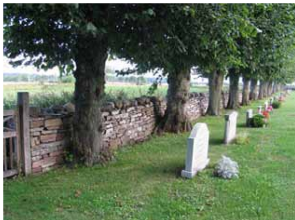
Kyrkogårdens mur och raden av hamlade lindar i väster. (KI Hulterstad kyrkog 009)