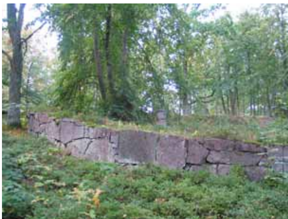
Begravningsplatsen från öster. (KI Korpemåla begravningsp 005)