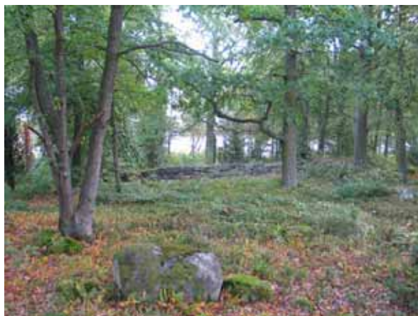
Begravningsplatsen från väster. (KI Korpemåla begravningsp 001)

Begravningsplatsen ligger i en skogsbacke som sluttar mot nordost. Mellan träden skymtar havet. Platsen är till ytan något oval. Endast ett mindre område har rensats från sten. I övrigt är marken inom begravningsplatsen stenbunden. Inom den stenfria ytan sätts urnor ner. I övrigt är platsen lik den omgivande blandskogen.