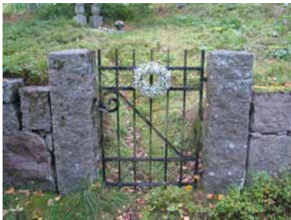
Ingången till kyrkogården i norr. (KI Korpemåla begravningsp 008)