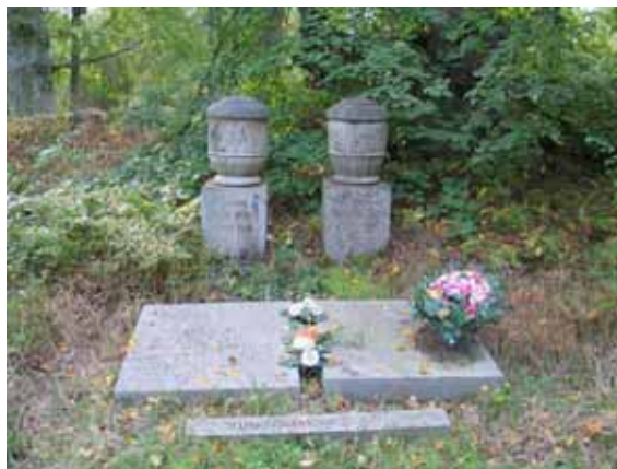
De fem gravvårdar som finns på Korpemåla begravningsplats. (KI Korpemåla begravningsp 015)