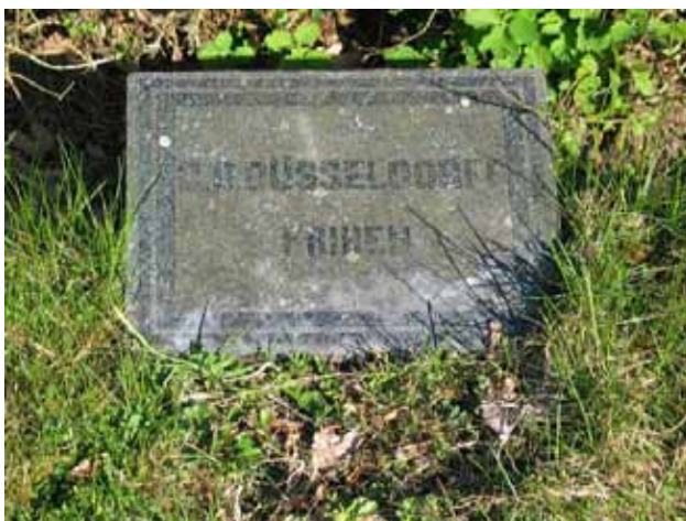
Kv. B, vårdan över den lokalthistoriskt kände "Düsseldorfaren".