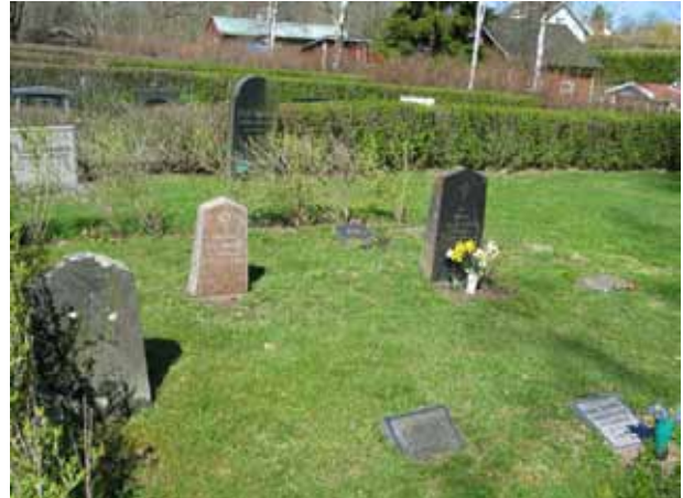
Området med barngravar i norra delen av kv. B. (KI Kristdala 0243)