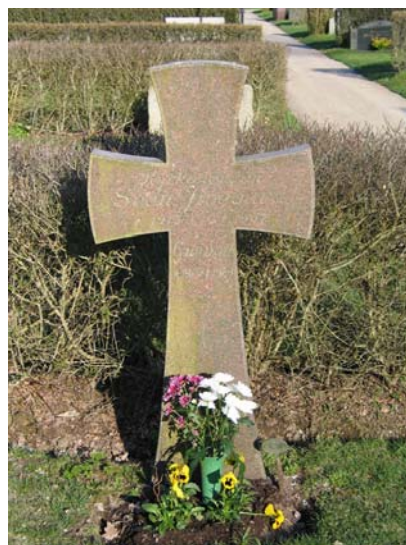
Kv. F, vårdan över kyrkoherde Sven Jivegård som var mycket aktiv i omdaning av kyrkogården under 1950-70-talen. (KI Kristdala 0273)