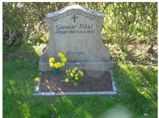
Kv. B, vård förfärdigad efter modell av lokal stenhuggare vid namn Walfred Ottosson. (KI Kristdala 0195)